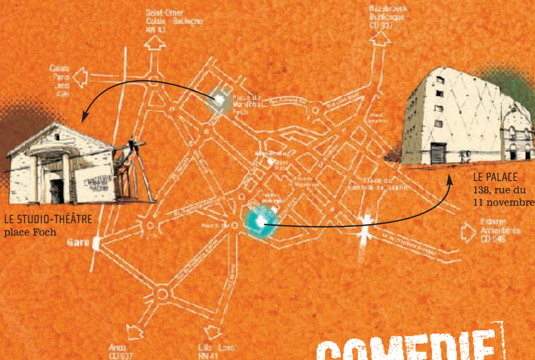
LE STUDIO-THÉÂTRE place Foch